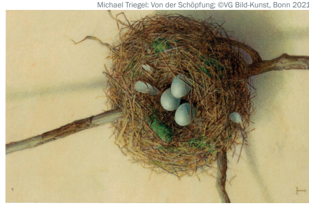
Michael Triegel: Von der Schöpfung; ©VG Bild-Kunst, Bonn 2021