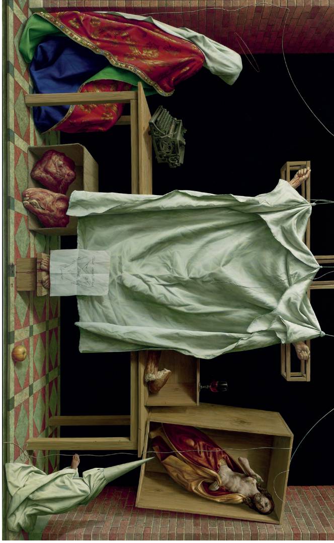
Michael Triegel: Deus absconditus; ©VG Bild-Kunst, Bonn 2021