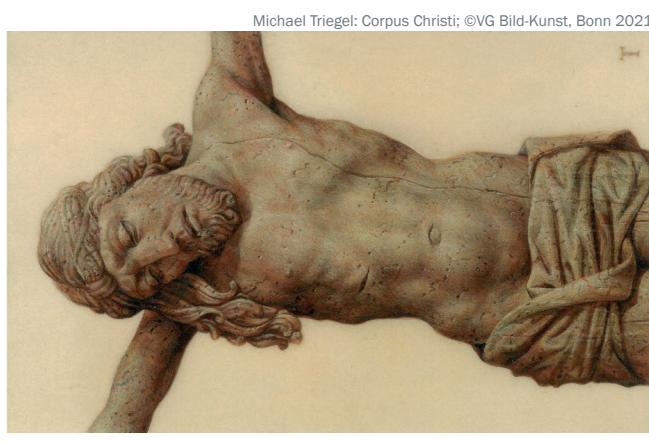
Michael Triegel: Corpus Christi