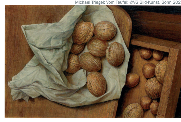
Michael Triegel: Vom Teufel; ©VG Bild-Kunst, Bonn 2021

8. Dezember 2021 Für die Toten Wein, für die Lebenden Wasser? Vorschrift für Fische?