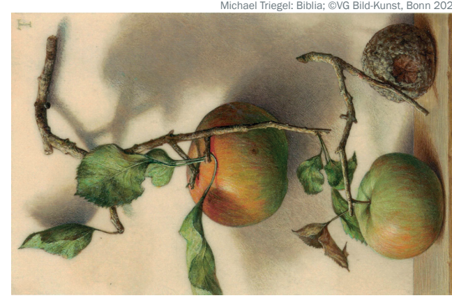
Michael Triegel: Biblia

Donnerstag, 18. November 2021 um 17.30 Uhr Fleisch und Blut – Was brauchen wir zum Leben?